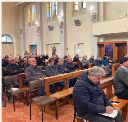
Incontro del clero delle diocesi di Grosseto e Pitigliano ad Albinia sul tema del sacramento della confessione