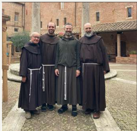
I frati minori il 20 dicembre ricorderanno i 100 anni di presenza a Grosseto