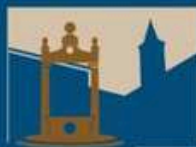
Convento San Francesco