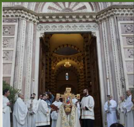
Il vescovo amministratore apostolico ostende la Croce ai fedeli radunati in piazza Duomo. 29 dicembre 2024