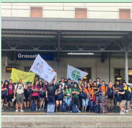
I giovani della diocesi di Grosseto in partenza per il Giubileo, lunedì 21 luglio scorso