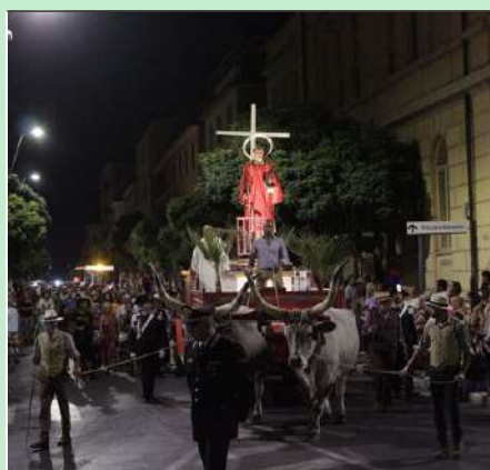
Un momento della processione di san Lorenzo del 9 agosto 2024. Ormai ci avviciniamo a grandi passi alle feste 2025