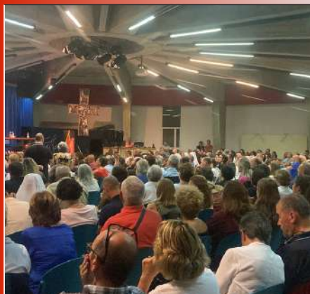
Un momento della tre giorni diocesana di formazione