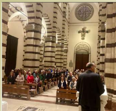
La lectio mensile iniziata il 5 ottobre in Cattedrale