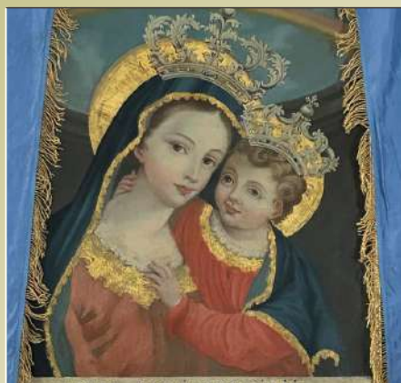
La Madonna del Buon consiglio venerata a Vetulonia