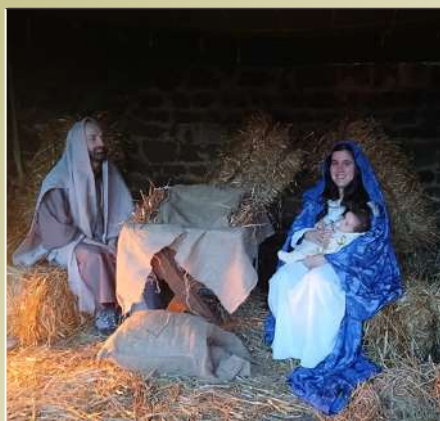
Un momento del presepe vivente a Castiglione della Pescaia