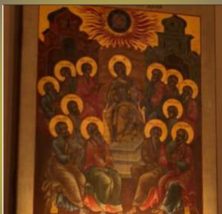
L'icona della Pentecoste. Cappella del Seminario Vescovile